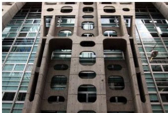
Banca di Londra, C. Testa, 1966