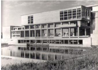
Facoltà di ingegneria, J. Vilamajò, 1936