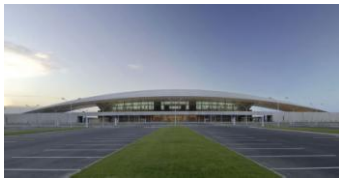
Aeroporto di Montevideo, R. Viñoly, 2009