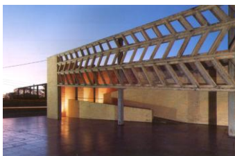
Sede Unilever, S. Benitez, 2001