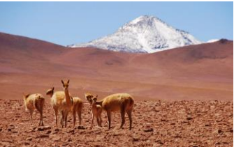
Vulcano Tocarपुरi, Deserto di Atacama

Trasferimento in hotel* e pernottamento.