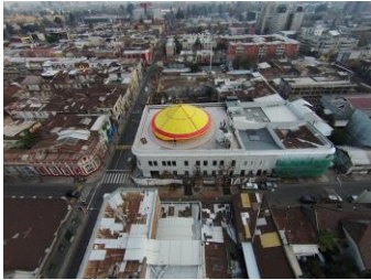
NAVE, Smiljan Radic, 2015

Nella fase esecutiva verrà elaborato il programma dettagliato del viaggio e degli edifici visitati, il quale potrà subire alcune modifiche rispetto al presente.