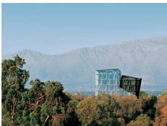
Siamese Tower, Alejandro Aravena, 2003

Prima colazione. Trasferimento in aeroporto. Incontro con l'assistente locale per le operazioni di imbarco e partenza con volo diretto per Calama, accoglienza e trasferimento a San Pedro de Atacama (1h30m). Il tragitto che supera la Cordillera Domeyko ci offre già un assaggio del paesaggio surreale che domina questa zona. Entriamo qui in una vasta area dove la potenza della Natura è costantemente presente. Nel tardo pomeriggio si visiteranno la Valle di Marte e la Valle della Luna, dove argilla, gesso e salgemma brillano con gli ultimi raggi del sole e che sarà il set naturale di uno spettacolare tramonto sullo sfondo del deserto di Atacama sotto l'occhio vigile dell'imponente Vulcano. Cocktail appositamente allestito al tramonto. Rientro a San Pedro. Cena libera e pernottamento in Hotel***.