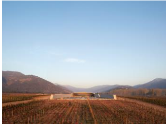
The Vinery at VK, Smiljan Radic, 2014