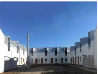
Colonia La Barnechea, A. Aravena, 2011