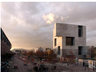
UC Innovation Center, A. Aravena, 2014