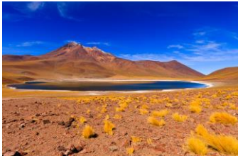
Miscanti, Deserto di Atacama

ESCURSIONE FACOLTATIVA: Escursione notturna astronomica.