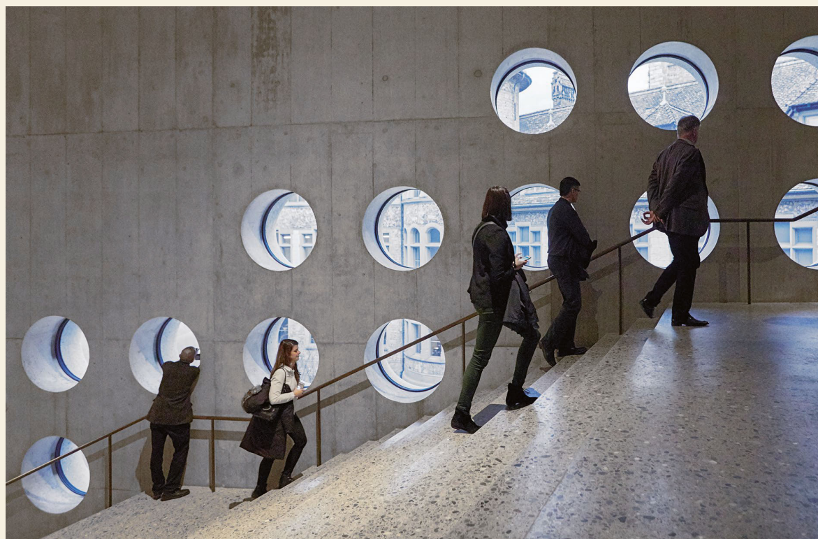
1 Scala nella nuova ala del Museo nazionale Zurigo, opera di Christ & Gantenbein.

Dalle ricerche risulta che le precedenti disposizioni erano in parte imprecise o applicate in modo erraneo, con il rischio di dimensionamenti poco sicuri, in particolare nel caso di calcestruzzi ad alta resistenza. Con la rettifica, tali errori involontari sono stati eliminati. Si sono inoltre precisate le disposizioni che tengono conto di un possibile stacco del calcestruzzo di copriferro.