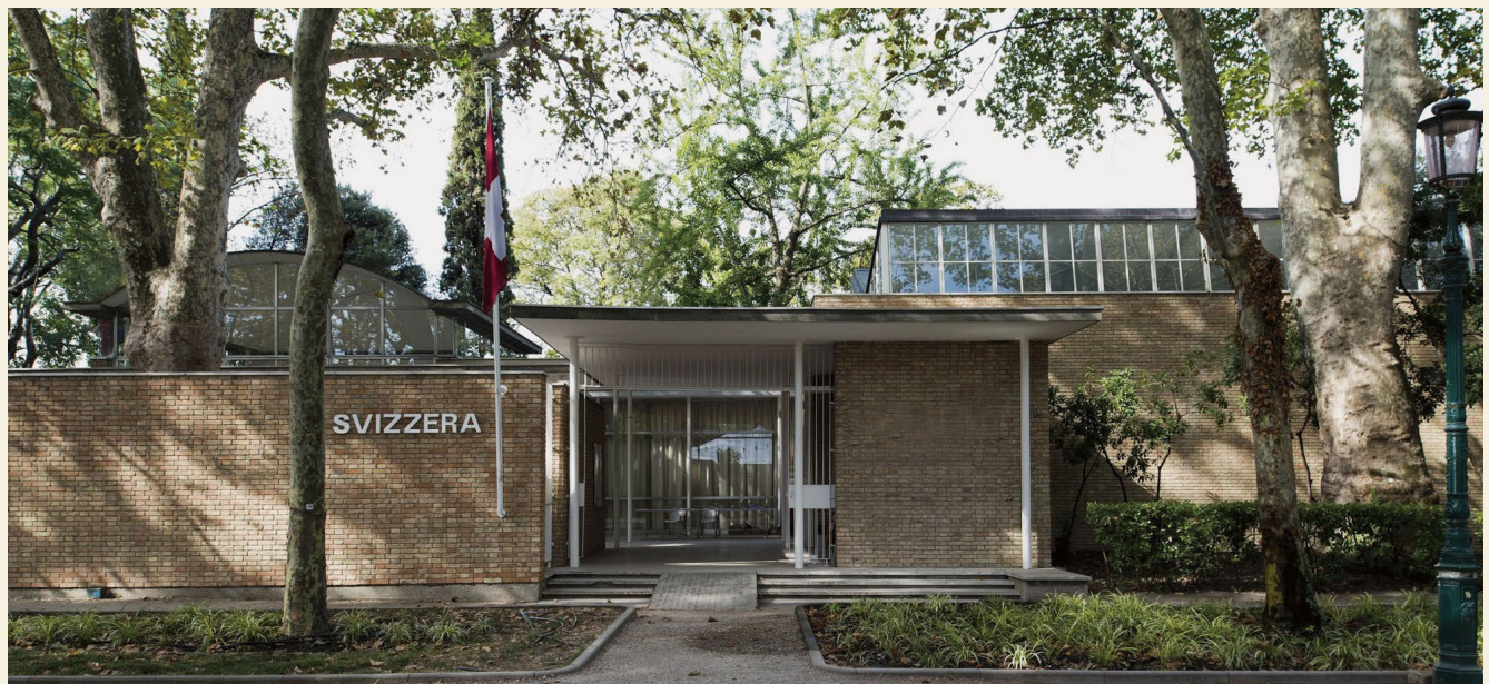
1 La Biennale 2018 aprirà in maggio, Padiglione svizzero ai Giardini, Venezia.

Per visualizzare i video della presentazione e della discussione (Basilea): https://youtu.be/KTPeKSNUhwk oppure https://youtu.be/iG9LS9DqyYQ